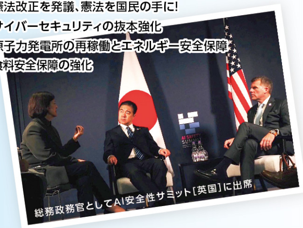
総務政務官としてAI安全性サミット[英国]に出席